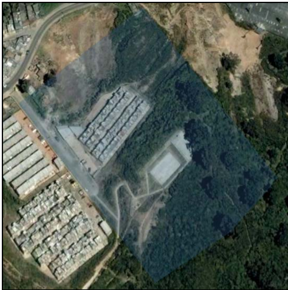
Figura No. 3. Polígono Urbanización Buena vista