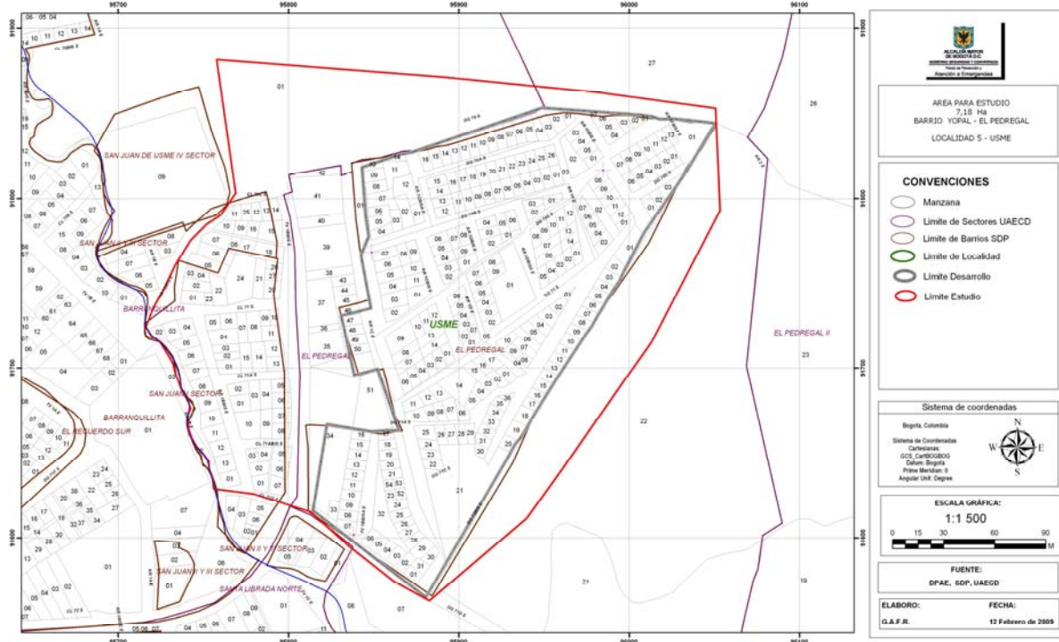
Figura No. 6. Polígono Barrios Yopal, San Juan I Sector, San Juan II Sector y San Juan III Sector - coordenadas planas con origen Bogotá.

La principal vía de acceso a la zona es la Avenida Caracas (Avenida Usme), por la cual se ingresa a lo largo de la Calle 72 Sur. El área de estudio se encuentra limitada al occidente por la Carrera 1B Bis Este y la Quebrada Santa Librada, al oriente y sur limita con la fábrica de ladrillos “Helios” y al norte con la fábrica de ladrillos “Prisma” (Ver Figura No. 2, en donde el recuadro azul representa la zona mínima de interés para obtención de la imagen).